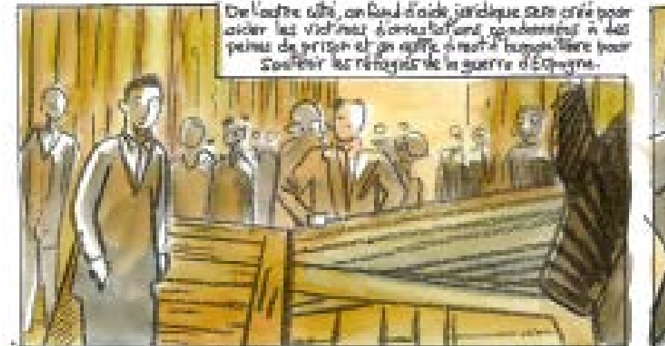
De l'autre côté, un fond d'aide juridique sera créé pour aider les victimes d'intimidation pendant et après la guerre et un comité d'aide humanitaire pour soutenir les réfugiés de la guerre d'Espagne.