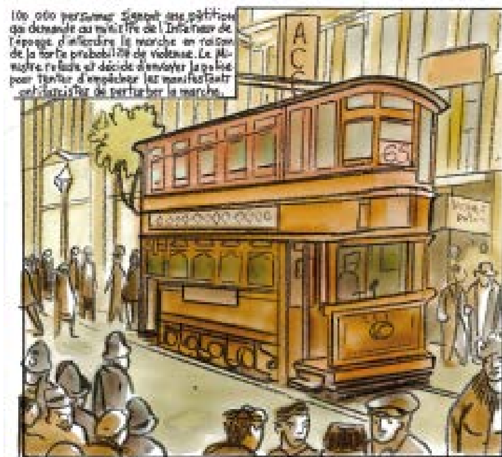
100 000 personnes signent des pétitions qui dénoncent au niveau de l'infamie de l'époque d'intimider la marche en raison de la forte probabilité de violence. Le ministre refuse et décide d'envoyer la police pour tenter d'empêcher les manifestants d'arrêter de perturber la marche.