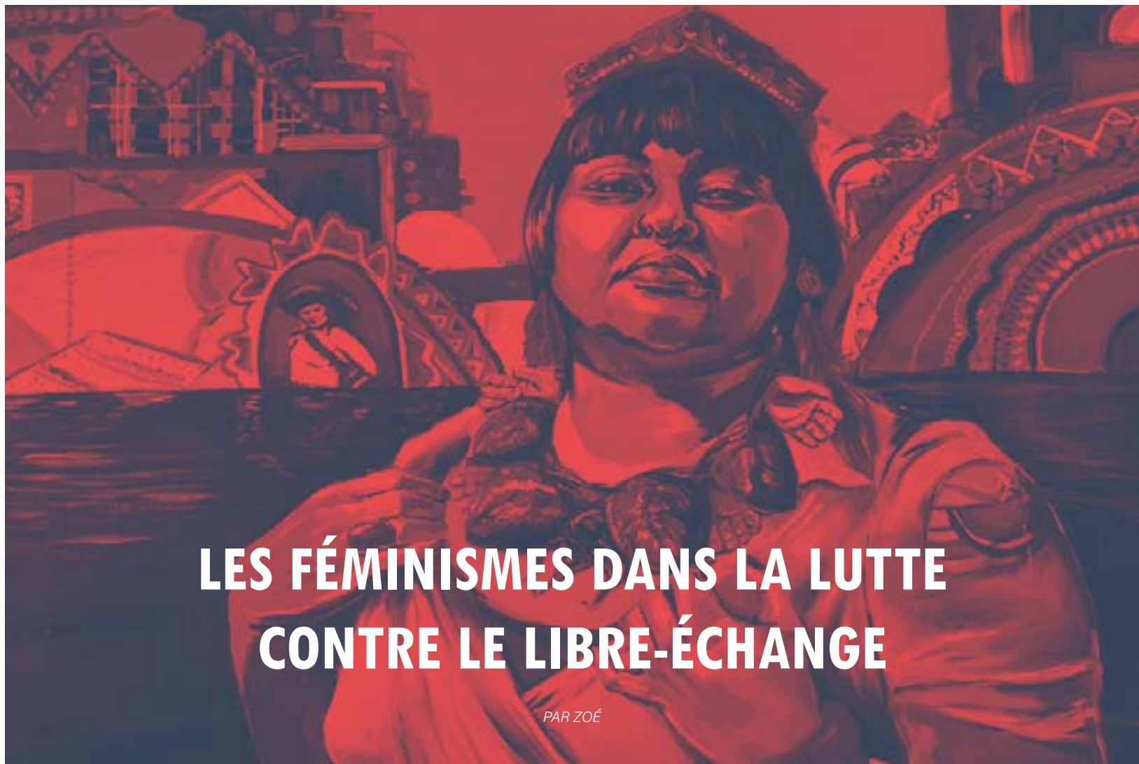
Coatlicue Statue: Josie Chammels the Goddess by Crystal Galindo