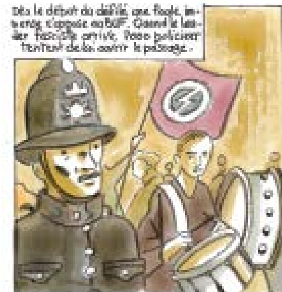
Dès le départ du défilé, une foule immense s'oppose au BUF. Quand le dernier fasciste arrive, deux policiers tentent de lui ouvrir le passage.