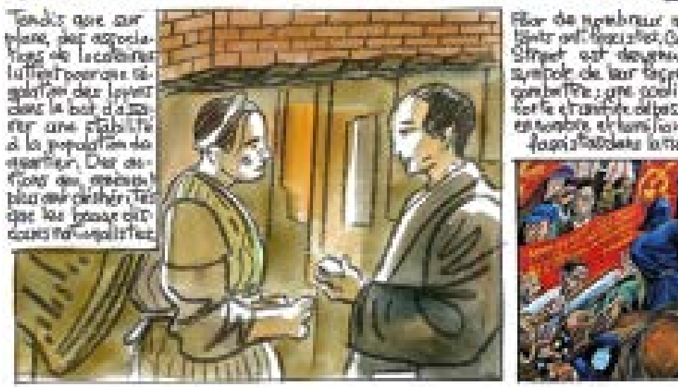
Tandis que sur place, des associations de femmes et de jeunes filles se réunissent. Elles organisent des soirées dans le but d'aider à la population de quartier. Des affiches sont apposées dans les rues pour que les fascistes ne puissent pas passer.