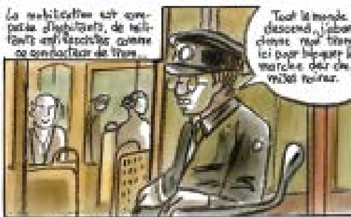
La manifestation est considérée comme une manifestation de masse.