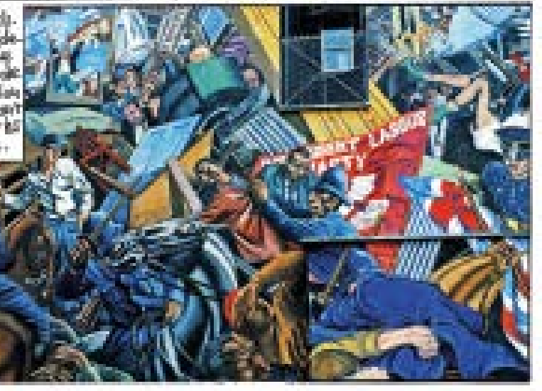
Plus de nombreux militants ont rejoint. Cable Street est devenue le symbole de leur lutte contre le fascisme, une coalition de forces et de personnes de tous les horizons qui ont travaillé ensemble.