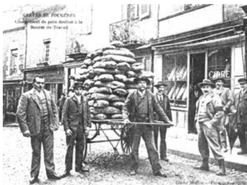
Grève des fougères, chargement de pain destiné à la Bourse du Travail

« LA CANTINE EST UN ESPACE DE CONVERGENCE DES VOLONTÉS, OÙ SE RENCONTRE DU CONCRET; OÙ SE FABRIQUE DU COMMUN ET DU LOCAL; OÙ À PARTIR DE RÉALITÉS CONCRÈTES, SE TISSENT DES FAÇONS DE VIVRE ORIGINALES; OÙ L'ON FAIT DE L'ANTICAPITALISME AVEC UN PEU D'ESPACE ET D'INGRÉDIENTS.