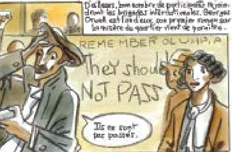
C'est aussi, un nombre de participants rejoignent les brigades internationales. George Orwell est l'un des premiers à venir sur la scène du quartier pour soutenir les réfugiés.