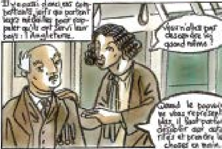
Il y a aussi des gens qui parlent sans réfléchir pour empêcher qu'ils ne servent leur pays. L'Angleterre.