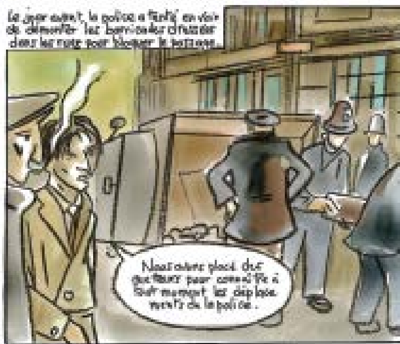
Le jour suivant, la police a tenté de démolir les barricades d'acier dans les rues pour bloquer la marche.