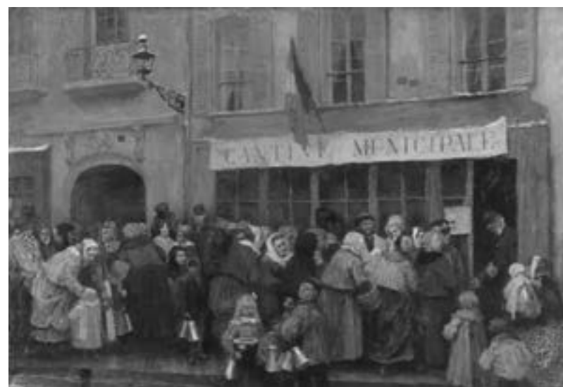
Une cantine municipale pendant le siège de Paris, 1870-1871.

Une occupation autonome ne pourrait subsister sans approvisionnement continu. On a entendu récemment parler de la ville de Quito qui a subi plus d'une semaine de siège par le gouvernement équatorien. Celui-ci a annoncé le recul de ses mesures, mais les individus descendus dans la rue ne semblent pas résolus à renoncer à leur moment de renversement ni à se résoudre à des négociations. Quelque chose de plus fondamental est en jeu. Et durant le siège, l'autonomie s'organise ; des cantines se mettent en place au même moment que des assemblées populaires se construisent. Ceux et celles qui ont