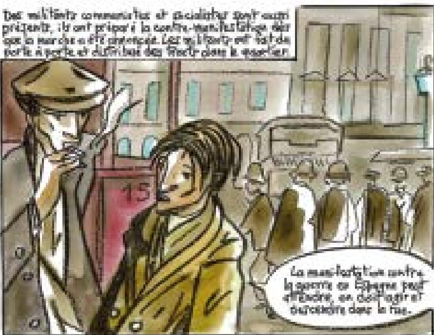
La manifestation contre la guerre en Espagne peut être considérée, en fait, comme la première manifestation de la lutte contre le fascisme.