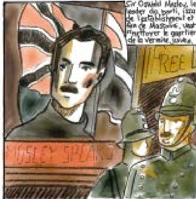
Oswald Mosley, le leader du parti, issu de l'aristocratie et fils de Mosley, veut transformer le quartier de la vermine, juive.