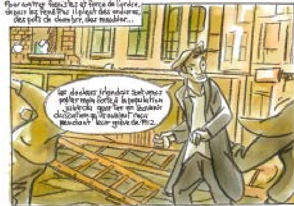
Les fascistes tentent de passer mais sont arrêtés par la police. Ils sont projetés au travers des vitrines et les fascistes tentent de passer mais sont arrêtés par la police.