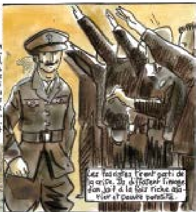
Les fascistes s'en vont de la parade. Ils diffuseront l'image d'un roi et de la leur riche aristocratie et de leurs partisans.

Le 4 octobre 1936, le British Union of Fascists (BUF) décide d'organiser une marche à travers l'East End, un quartier populaire de Londres. Le quartier est habité par des irlandais et par une population juive qui a fui les pogroms de Russie et Pologne au début du 20 ème siècle. Le trafic des autobus 30généralise la destruction de nombreux ateliers mais malgré la misère, le quartier est riche d'activités culturelles, de clubs de sport et d'une vie très riche et solidaire.